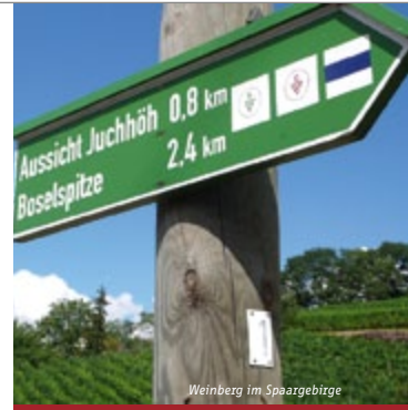
Weinberg im Spaaengebirge