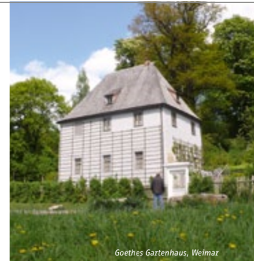
Goethes Gartenhaus, Weimar