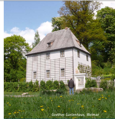
Goethes Gartenhaus, Weimar

Strecke Ilmenau – Merseburg Streckenlänge ca. 170 km Tagesetappen ca. 20 – 45 km Schwierigkeit mittel Buchungscode ILM7