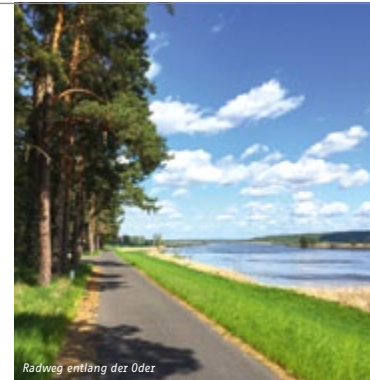
Radweg entlang der Oder