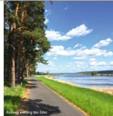
Radweg entlang der Oder