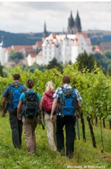
Weinberg in Proschwitz