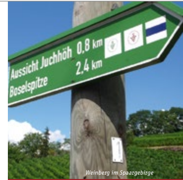
Weinberg im Spaaergebirge