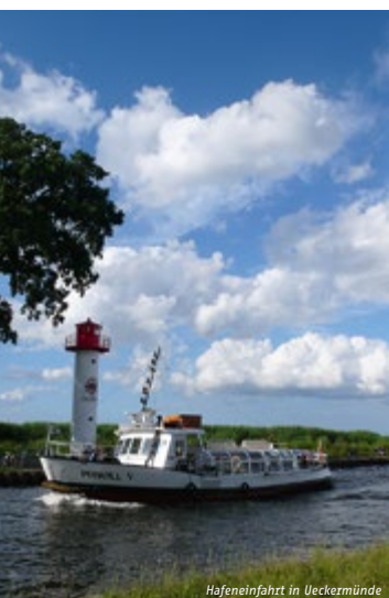
Hafeneinfahrt in Ueckermünde