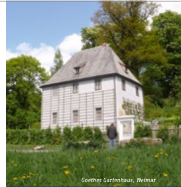
Goethes Gartenhaus, Weimar

Strecke Ilmenau – Naumburg Streckenlänge ca. 130 km Tagesetappen ca. 20 – 45 km Schwierigkeit mittel Buchungscode ILM6